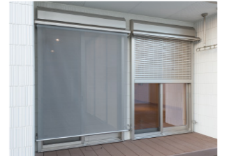
シャッター／ひさしの付いている窓